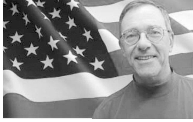
Amerika’dan ithal Douglas Futuyma “Konusu uyuma ve uyutma”

Gerçekler böyleyken ve herkes bunun farkındayken, bu şaman rahiplerini boş yere para verip getirtiyorsunuz. Bunların anlattıkları Sümer efsanelerini ve eski Mısır efsanelerini kapalı salonlarda dinleyerek pinekleme, boş yere masraf ve vakit kaybindan başka bir şey değil. Pagan rahiplerini getirterek bir çözüm olmaz. Bu pagan rahiplerine sorun, “ TEK BİR ARA FOSİL VAR MI? ” diye. Eğer varsa kendilerinden bunu getirip göstermelerini isteyin. Eğer gösterebilirlerse kendilerine 10 trilyon TL verileceğini söyleyin. Eğer getiremezlerse yalan söylüyorlar demektir, onlara inanmayın. Bu kişilere, ele geçmiş olan “ 100 milyon fosilin tamamının tam ve mükemmel canlılara ait olup olmadığını ” sorun. Onlara “ atın evriminin doğru olup olmadığını ” sorun. Fosilleri, Yaratılış gerçeğini ispat ettikleri için “ yıllarca saklayıp saklamadıklarını ” sorun. “ Bir proteinin tesadüfen meydana gelmesinin imkansız olup olmadığını ” ve “ bunun farkında olup olmadıklarını ” sorun.