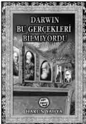
DARWİN BU GERÇEKLERİ BİLMİYORDU (EVİRİMCİLERE NET CEVAP .3.)