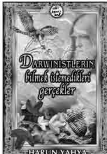
DARWİNİSTLERİN BİLMEK İSTEMEDİKLERİ GERÇEKLER (EVİRİMCİLERE NET CEVAP .4.)