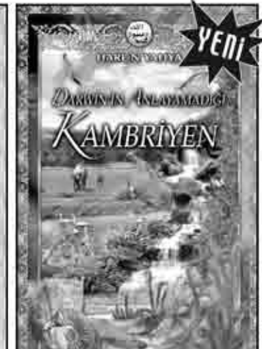
DARWİN'İN ANLAYAMADIĞI KAMBRIYEN