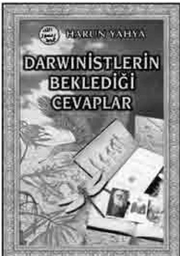
DARWİNİSTLERİN BEKLEDİĞİ CEVAPLAR (EVİRİMCİLERE NET CEVAP .2.)