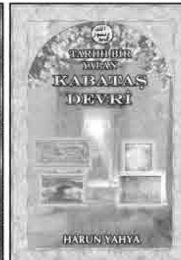
TARİHİ BİR YALAN: KABATAŞ DEVRİ