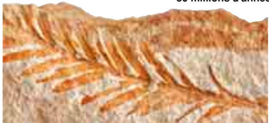
METASEQUOIA 50 millions d'années