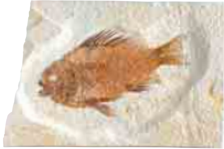
POISSON-LUNE 54 à 37 millions d'années