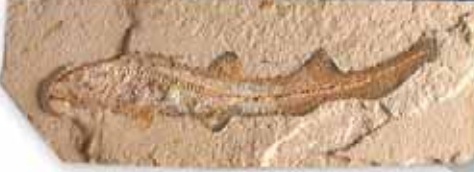
75 milyon yıllık köpekbalığı fosili

Bu açık gerçeğe rağmen evrim teorisine göre; ilk ortaya çıkan köpek balıklarının yani "ilkel köpek balıklarının" günümüzdekiler gibi elektrik algılayıcılarının olmadığını, ancak zaman içinde bu mükemmel sistemin bir şekilde oluştuğunun kabul edilmesi gerekir. Ancak böyle bir kabulün mantıksızlığı çok açıktır, çünkü köpek balıklarının bu sistem olmadan yaşaması mümkün değildir. Ayrıca böyle kompleks bir sistemin zamanla oluşamayacağı da ortadadır. Vücut kaslarının ısısını direkt olarak gözlere aktaracak, elektrik dalgalarını muazzam bir hassasiyetle fark edecek bu sistemler bir bütün olarak ortaya çıkmak zorundadırlar.